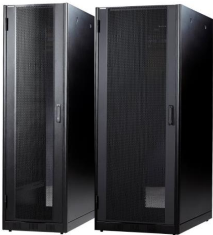
27HE / 1200 højde 2 varianter: bredde 600 og 800, dybde 1000