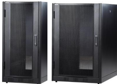
42HE / 2000 højde 2 varianter: bredde 600 og 800, dybde 1200